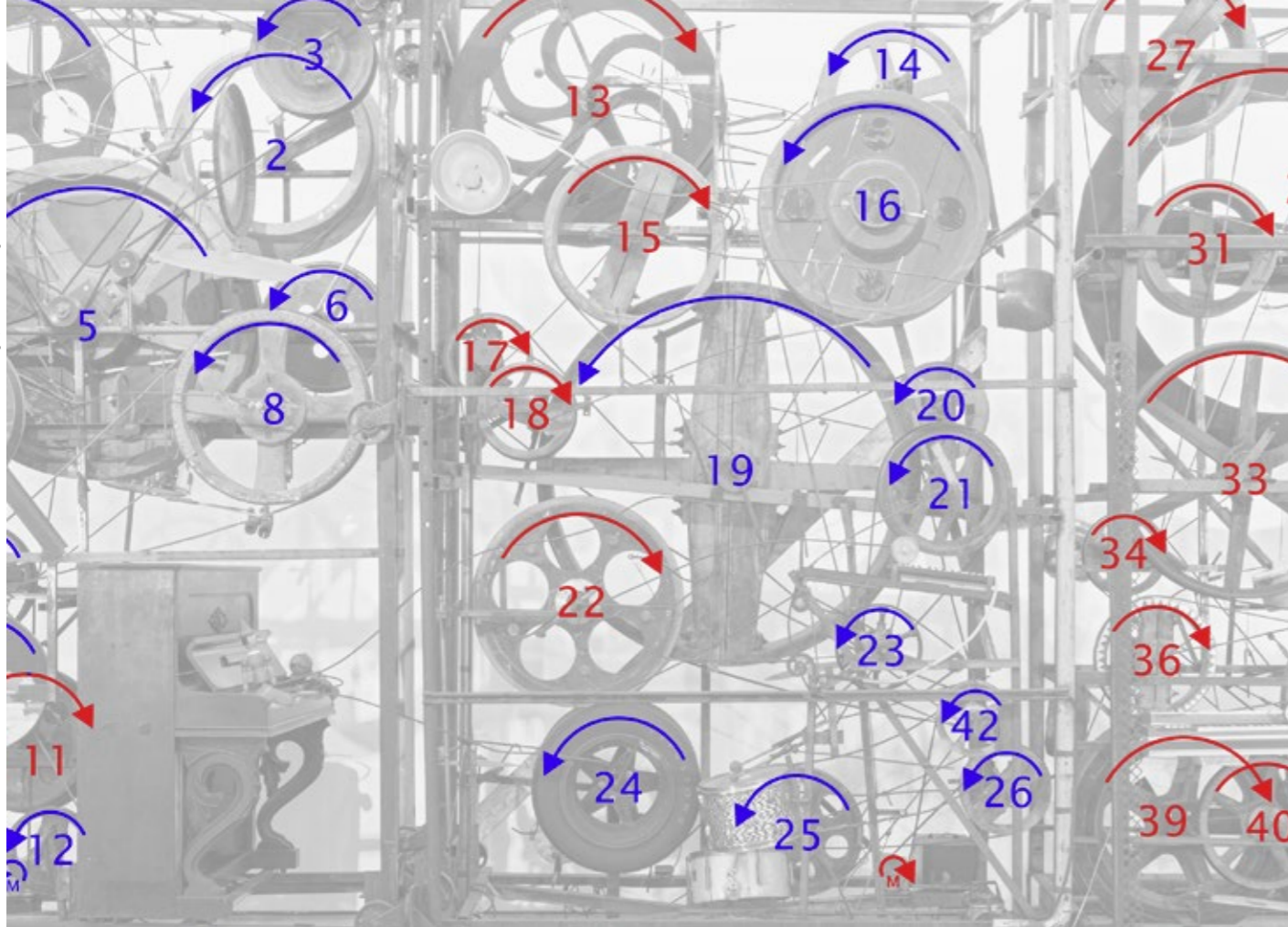
Dokumentation: Von der «Méta-Harmonie II» existierten keine Konstruktionspläne. Eine technologische Bestandesaufnahme trug dazu bei, die Funktionsweise des Werks zu verstehen. Bild unten: Detailaufnahme der Maschine.