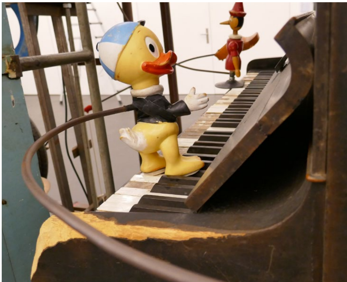
Bild oben: Donald Ducks Neffe Trick hatte den Klaviertasten ordentlich zugesetzt – und sie ihm. Die Ersatzfigur ist nun mit einem Metallskelett verstärkt und fällt auch den Tasten zuliebe weniger tief als früher. Für den Fall, dass auch dieser Trick irgendwann nicht mehr standhält, wurde ein 3D-Scan gemacht, so dass man ihn nachbilden könnte. Am Pinocchio mussten lediglich die Arme neu montiert werden.