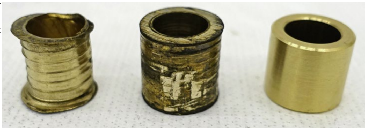
Um den Verschleiss zwischen zwei beweglichen Teilen zu minimieren, setzten die Assistenten des Künstlers Messingbuchsen ein.