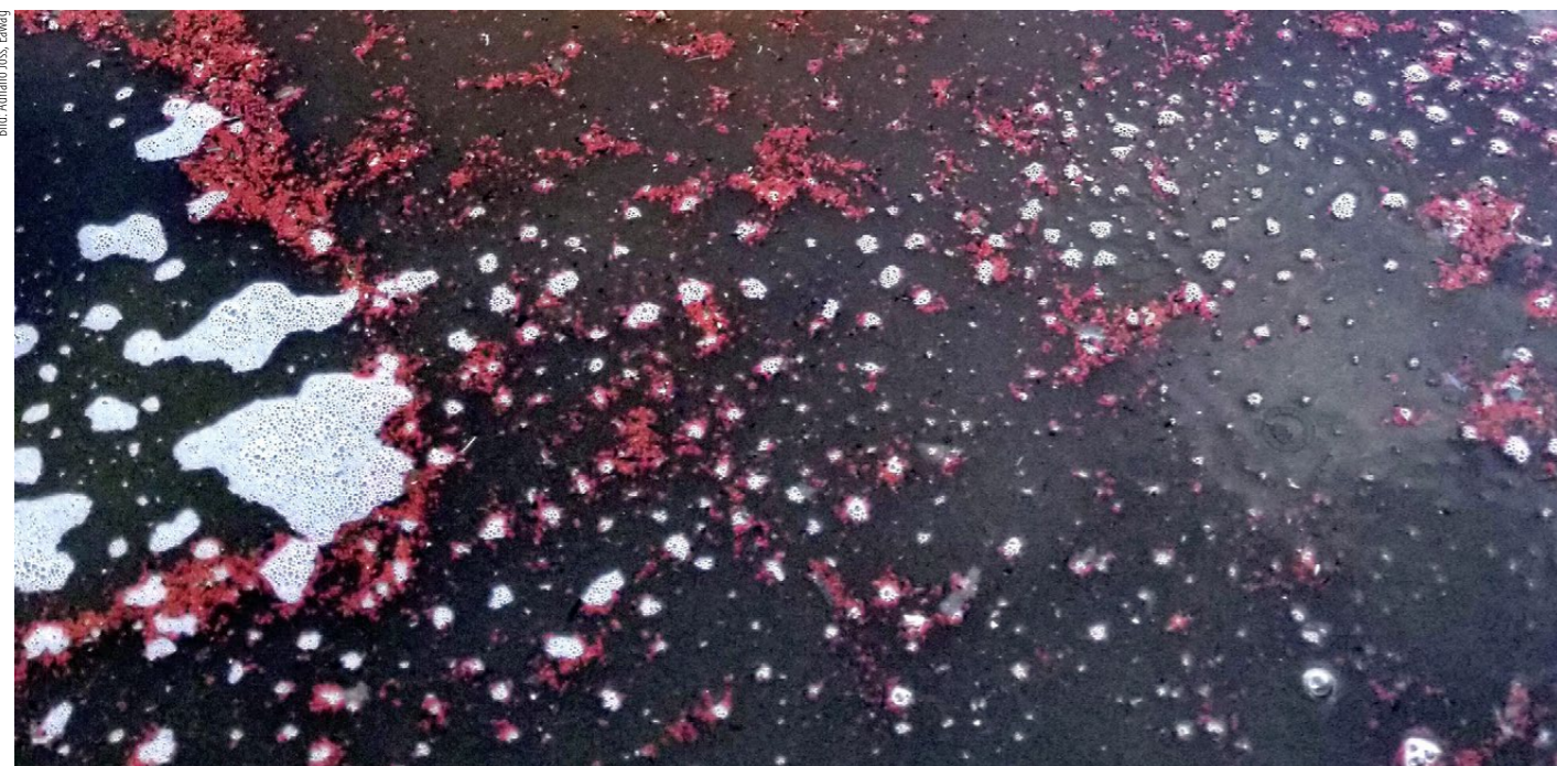
Schlammteilchen mit den typisch roten Anammox-Bakterien in der Kläranlage Mohnheim am Rhein (DE).

* Claudia Carle ist Wissenschaftsredaktorin bei der Eawag