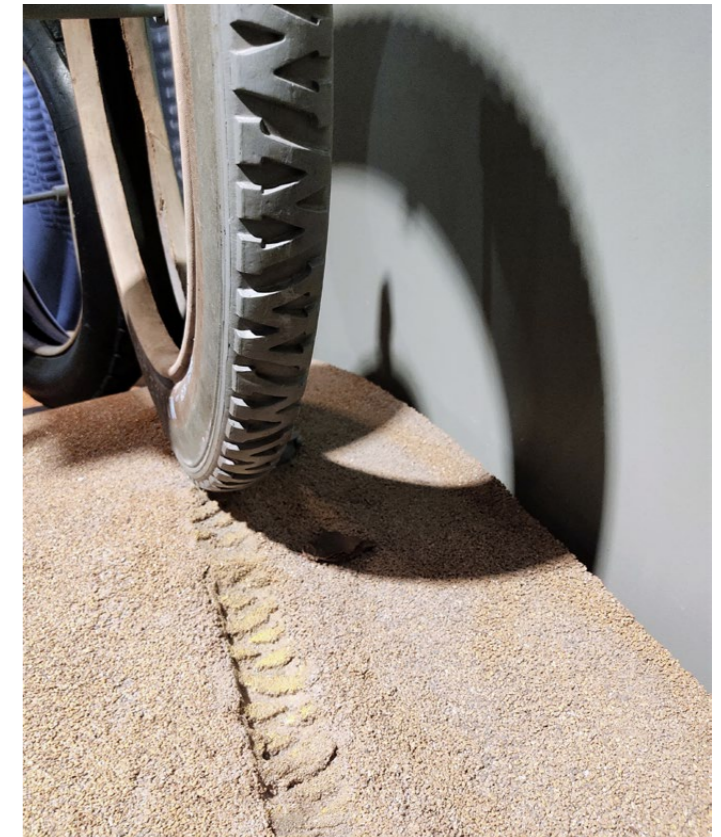
Früher Werbegag: Michelins erstes Reifenprofil war eher dem Marketing geschuldet. Denn dieser Reifen hinterliess im Strassenstaub eine Endlosreihe mit dem Buchstaben «M».