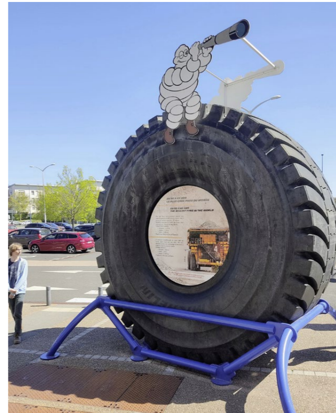
Der Stolz des Unternehmens: Der grösste Reifen der Welt mit einem Durchmesser von 4,03 Metern. Er kommt bei Transportfahrzeugen zum Einsatz, die voll beladen bis zu 600 Tonnen wiegen.