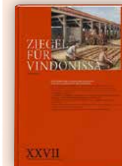
Gratis zu beziehen als PDF über https://edoc.unibas.ch/89888/1/Ziegel_fv_GPV_XXVII_edoc.pdf