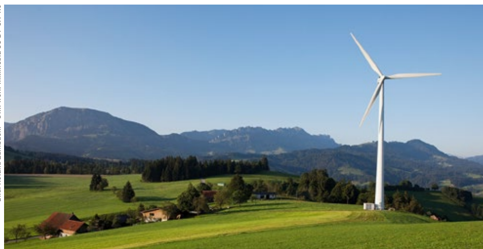
Hoch über dem Dorf Entlebuch steht dieses Windrad auf dem Hügelkamm. Auch an anderen Orten ist das Potenzial für Windenergie vorhanden. Der Kanton möchte es verstärkt nutzen.

Einen Sonderkredit in Höhe von 85 Millionen Franken zur Unterstützung der Krienser Pflegeheime AG nahm indes der lokale Souverän an. Die Summe beinhaltet das mit 70 Millionen Franken veranschlagte Neubauprojekt des Alters- und Pflegeheims Grossfeld sowie die Sanierung zweier weiterer Heime. In Sursee erteilte das Stimmvolk Grünes Licht für den Sonderkredit über 45,8 Millionen Franken für den Ersatzneubau des Alterszentrums St. Martin. Auch für den 19-Millionen-Kredit für ein Schulhaus-Projekt in Rain gab es ein Ja. ■