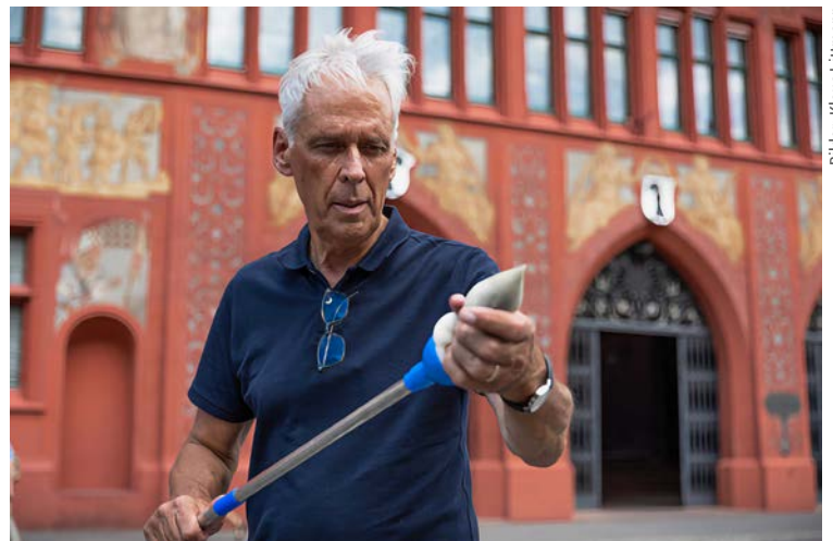
Bilder: Klaus Littmann

Zur Ausstellung liess Littmann alles rahmen. In den Räumlichkeiten an der Rittergasse hat er genug Platz, Gross' gesamte Sammlung zu zeigen. Das Gespräch dort wird immer wieder unterbrochen von Besucherinnen und Besuchern, die Fragen stellen oder sich über Giacomettis Werk unterhalten möchten. «Das ist der Grund, warum ich es mir nicht nehmen lasse, jeden Tag ein paar Stunden vor Ort in der Ausstellung zu sein», erläutert Littmann. «Das ist eine einmalige Chance, spannende Gespräche mit Ausstellungsbesuchern zu führen, zu erfahren, wie sie die Kunst und ihre Darstellung empfinden.» →