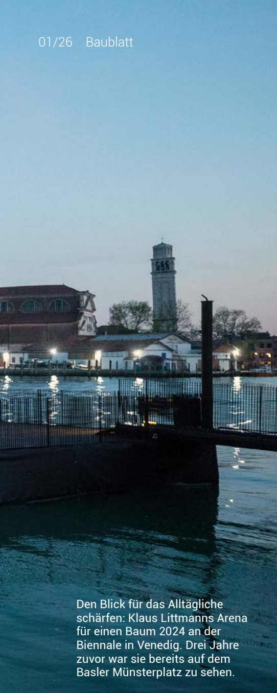
Den Blick für das Alltägliche schärfen: Klaus Littmanns Arena für einen Baum 2024 an der Biennale in Venedig. Drei Jahre zuvor war sie bereits auf dem Basler Münsterplatz zu sehen.

wusst war, was er da hortete? Littmann erinnert sich: «Die Skizzen und Zeichnungen waren nicht einmal gerahmt. Der Paris-Zyklus lag en Bloc in einer Kiste.»