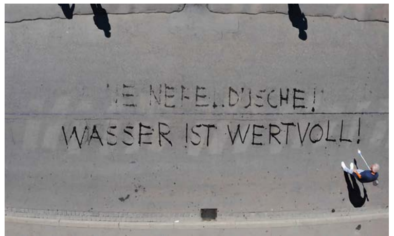
Vor dem Basler Rathaus machte Klaus Littmann mit seiner Strassenaktion «The Blue Gold» im Sommer 2022 auf den Wert des Wassers aufmerksam.