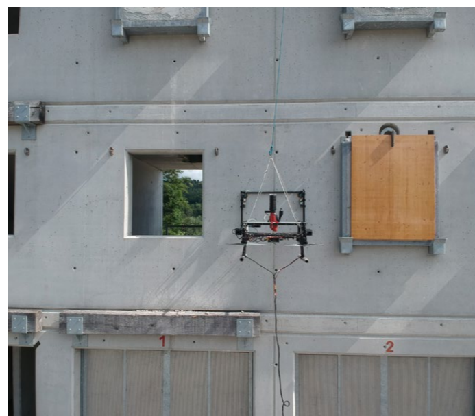
Am Ende des Eingriffs löst sich die Drohne wieder von der Wand und fliegt zum nächsten Einsatzort.

reicht. Löcher bis zehn Millimeter Durchmesser wurden so etwa bereits gebohrt, doch auch deutlich grössere sind möglich.