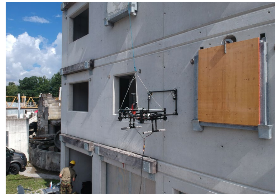
Anflug zum Einsatzort: Der Drohnenbohrer wird mit einer handelsüblichen Fernsteuerung bedient.

Dieser Problematik widmet sich seit Herbst 2021 ein Focus Project der ETH Zürich: Acht Studierende, sechs Maschinenbau- und zwei Elektroingenieure, arbeiten