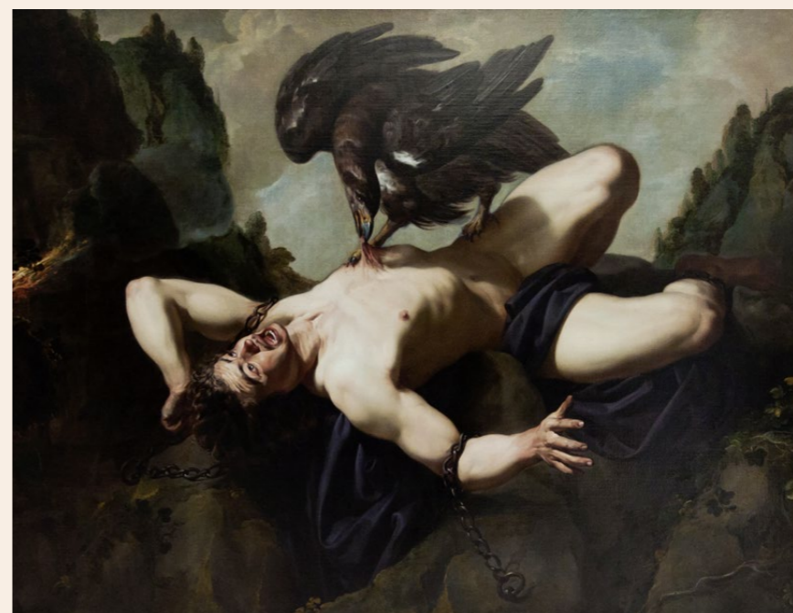
Ein Gemälde des niederländischen Barockkünstlers Theodoor Rombouts zeigt Prometheus und den Adler Aithon, respektive Ethon.

Somit könnte der Drohnenbohrer Aithon dereinst möglicherweise dabei helfen, die Unfallstatistik weiter zu verbessern. Denn, dies dürfte die Suva zum Welttag für Sicherheit und Gesundheit am Arbeitsplatz auch vermelden, das Risiko, in der Schweiz am Arbeitsplatz zu verunfallen, ist in den vergangenen zehn Jahren um 13 Prozent gesunken. Auf einem leider hohen Niveau stagniert hingegen die Zahl der Absturzunfälle. Innovationen wie die Spezialdrohne könnten wohl einige verhindern. ■