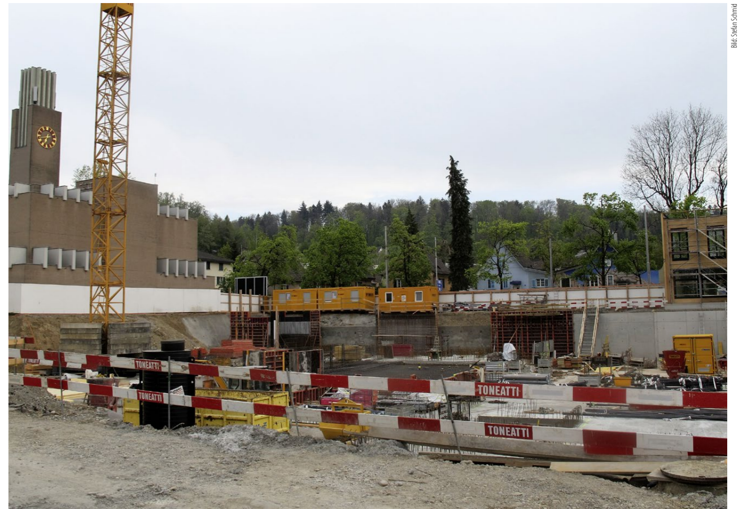
Beim Kirchenzentrum Glaubten in Zürich entsteht ein Neubau, in dem das Sozialwerk Pfarrer Sieber eine Anlaufstelle für Menschen in Not einrichten wird.

Gleichzeitig beklagte jüngst die Hälfte der Unternehmen den Arbeitskräftemangel im Baugewerbe. Damit hat sich das Problem im Vergleich zur Situation beim Jahresbeginn nochmals akzentuiert. Zusätzlich behindert jetzt die Knappheit von Material und Vorprodukten wieder vermehrt die Leistungserbringung. Diesbezüglich melden aktuell 51 Prozent der Bau-