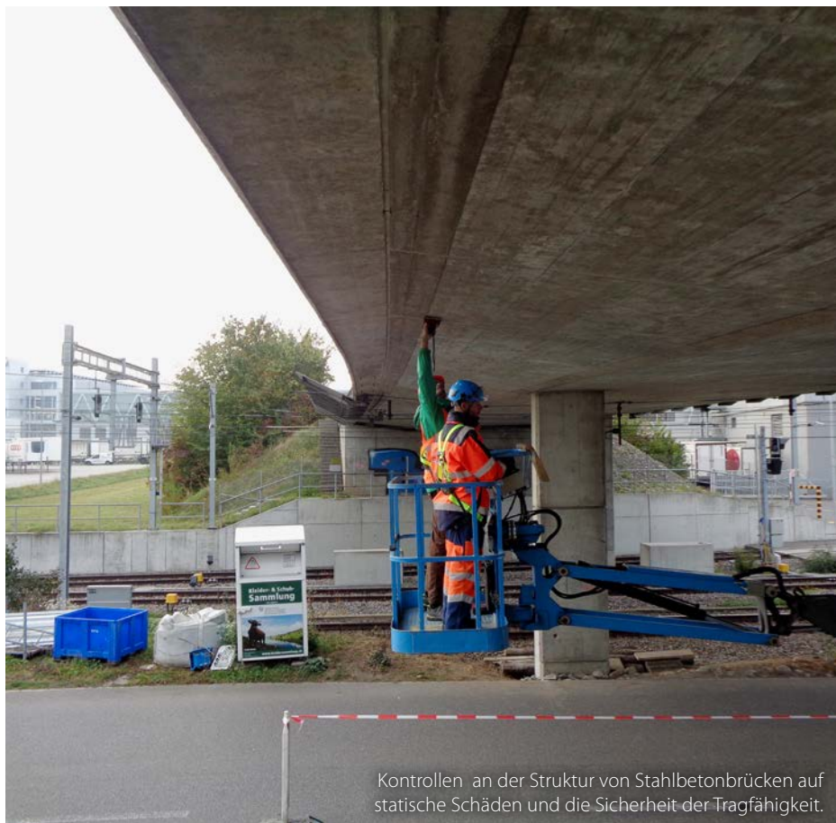
Kontrollen an der Struktur von Stahlbetonbrücken auf statische Schäden und die Sicherheit der Tragfähigkeit.

«Wichtig ist allerdings, nur mit einem zentralen Modell zu arbeiten, das alle Angaben beinhaltet. Die verwendete BIM-Software hat sich beim vorliegenden Erhaltungsprojekt als sehr zuverlässig und benutzerfreundlich erwiesen», sagt Ivan Markovic. ■