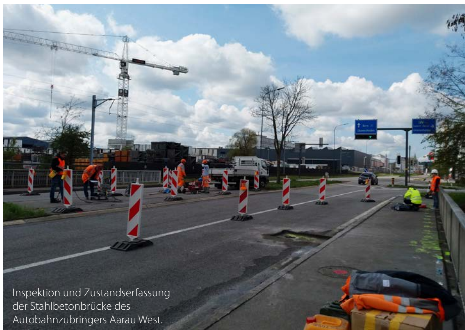
Inspektion und Zustandserfassung der Stahlbetonbrücke des Autobahnzubringers Aarau West.

Robuste, unterhaltsarme und langlebige Bauwerke, die über die gesamte Nutzungsdauer möglichst niedrige Lebenszykluskosten verursachen, sind das Ziel aller Baumassnahmen des Tiefbauamts (TBA) des Kantons Zürich. Dem Amt obliegen die Erstellung, die regelmässige Überwachung