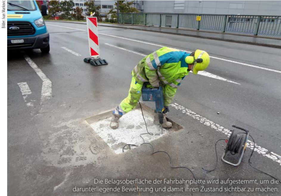
Die Belagsoberfläche der Fahrbahnplatte wird aufgestemmt, um die darunterliegende Bewehrung und damit ihren Zustand sichtbar zu machen.

Um eine Vereinfachung bezüglich der gesamtschweizerisch vorhandenen Richtlinien im Bereich Kunstbauten zu erreichen, hat das Tiefbauamt das Fachhandbuch Kunstbauten entwickelt, das auf den Richtlinien und dem Fachhandbuch K des Astra basiert. Es ist im Internet abrufbar: www.zh.ch/de/planen-bauen/tiefbau/strassenanlagen/kunstbauten.html .